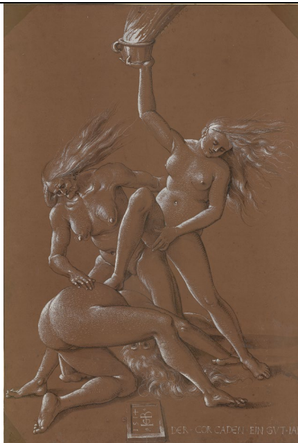
Hans Baldung gen. Grien (Schwäbisch Gmünd 1484/85–1545 Straßburg) Neujahrsgruß mit drei Hexen 1514 Feder und Pinsel in Schwarz und weißer Deckfarbe auf braun grundiertem Papier ALBERTINA, Wien