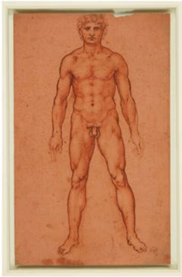
Leonardo da Vinci Stehender männlicher Akt 1503–1506 Rötel, Feder in Braun auf rot präpariertem Papier Windsor Castle, London, RCIN 912594