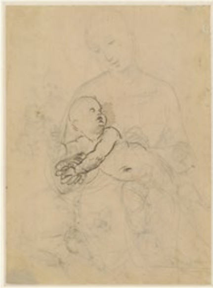
Raffael Studie zur Bridgewater-Madonna (Recto) Um 1506–1507 Metallstift und Feder auf bräunlich grundiertem Papier ALBERTINA, Wien