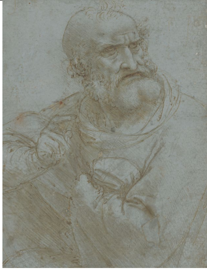
Leonardo da Vinci Halbfigur eines Apostels 1493-1495 Silberstift, Feder in Braun, auf blau grundiertem Papier ALBERTINA, Wien