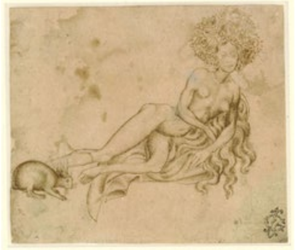
Antonio Pisano, gen. Pisanello Allegorie der Luxuria (Recto) Um 1426 Feder in Braun, Spuren von Metallstift oder schwarzer Kreide auf gerötetem Papier ALBERTINA, Wien