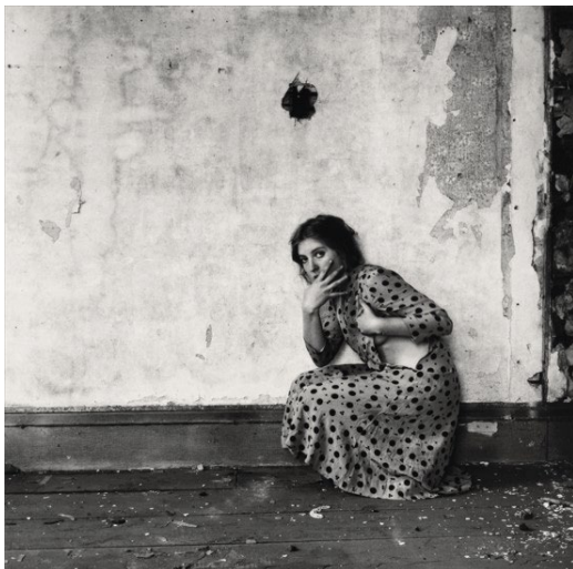
Francesca Woodman Polka Dots, Providence, Rhode Island, 1976/2000 Schwarz-Weiß-Silbergelatineabzug auf Barytpapier 13,1 x 13,2 cm Sammlung Verbund, Wien