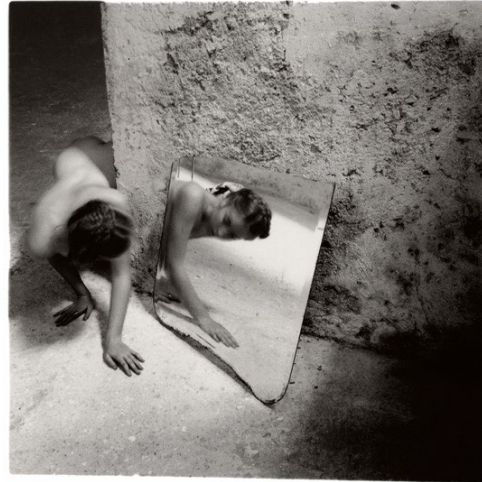
Francesca Woodman Self Deceit #1, Rome, Italy 1978/1979 Schwarz-Weiß-Silbergelatineabzug auf Barytpapier 9 x 9 cm Sammlung Verbund, Wien © 2025, Woodman Family Foundation / Bildrecht, Wien