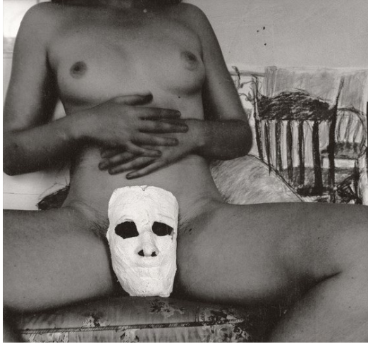
Francesca Woodman Face, Providence, Rhode Island, 1975-1976/1997-1999 Schwarz-Weiß-Silbergelatineabzug auf Barytpapier 12 x 12,5 cm Sammlung Verbund, Wien

Sie haben die Möglichkeit, folgende Bilder auf www.albertina.at im Bereich Presse abzurufen. Rechtlicher Hinweis: Die Bilder dürfen nur im Zusammenhang mit der Berichterstattung über die Ausstellung abgebildet werden.